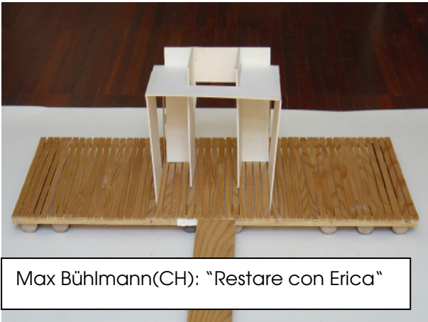
Max Bühlmann(CH): "Restare con Erica"

Un progetto che si spazia nell' area pubblica tra acqua e terra, e tra l'area di confine (due zone regionali) del "quarto del bosco" e del "quarto del mosto" .